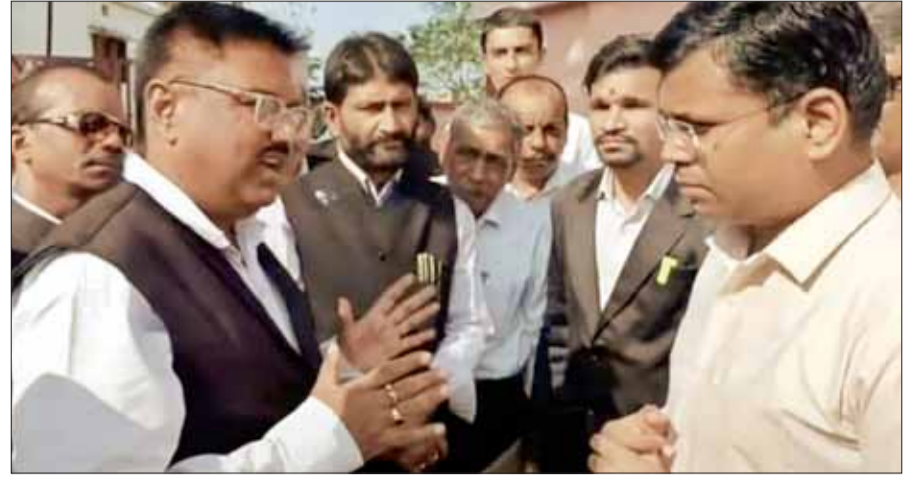
मनमाना रवेया अपनाने एवं कार्य प्रणाली को लेकर है रोष